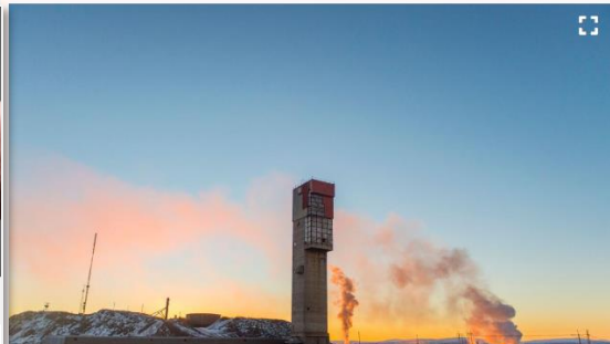
Gruvan i Kiruna.

Polisen varnar nu för att industrisatsningarna i norr hotas av utländskt spionage, uppger SVT.