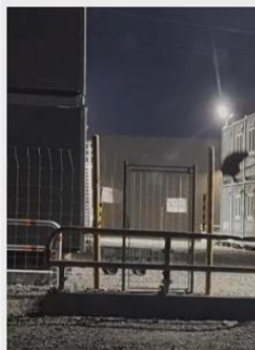
Se när arbetare smiter in genom grindarna vid batterifabriken i Skellefteå