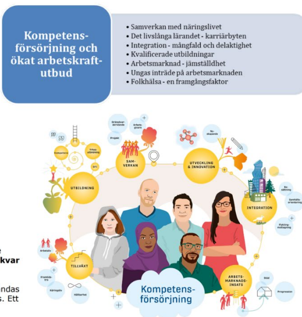
Figur 1. Sammanställning av strategier i urval

Tillgången till personer i yrkesverksam ålder är viktig för försörjningen av de invånare som inte arbetar. Det är av yttersta vikt att människor vill stanna kvar och/eller återvända/flytta in till kommunen. Fokus bör vara att attrahera kvinnor för en jämnare könsfördelning. Personalförsörjningen inom flera basverksamheter (skola, äldreomsorg med flera) behöver förstärkas. Nyanländas och funktionsnedsattas inkludering på arbetsmarknaden behöver underlättas. Ett livslångt lärande bör uppmuntras.